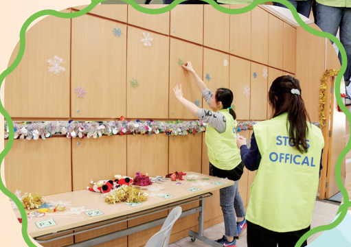
漫天雪花將與同學們迎來節日