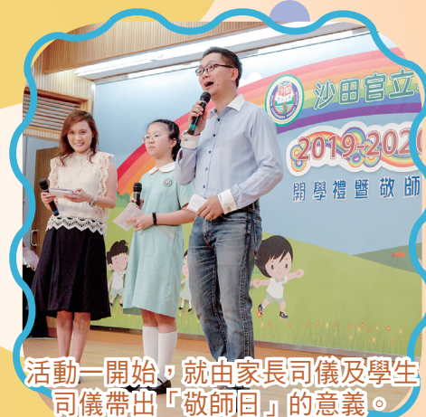
活動一開始，就由家長司儀及學生司儀帶出「敬師日」的意義。