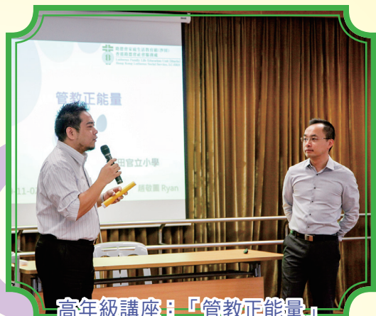
高年級講座：「管教正能量」