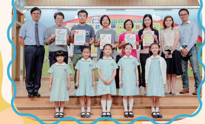
曾校長和兩位副校長代表全體老師接受家長教師會精心準備的禮物

歌聲過後，曾校長和兩位副校長代表全體老師接受家長教師會致送的禮物，讓學生也感受到家長對老師的感激。最後，由學生代表向各位老師送贈心意咭表達敬意，場面溫馨。