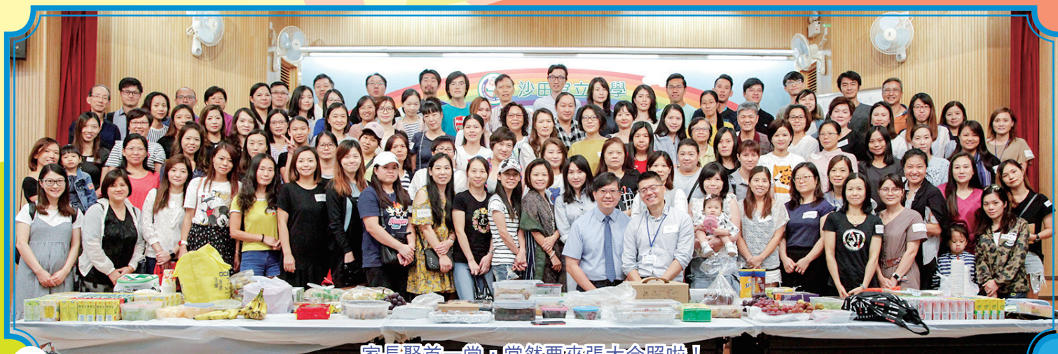
家長聚首一堂，當然要來張大合照啦！