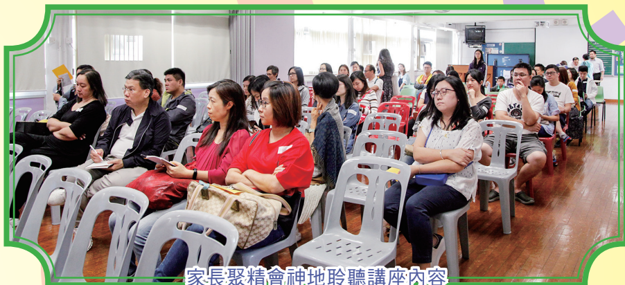
家長聚精會神地聆聽講座內容