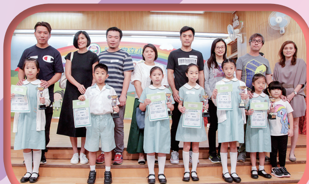
四年級得獎家庭合照