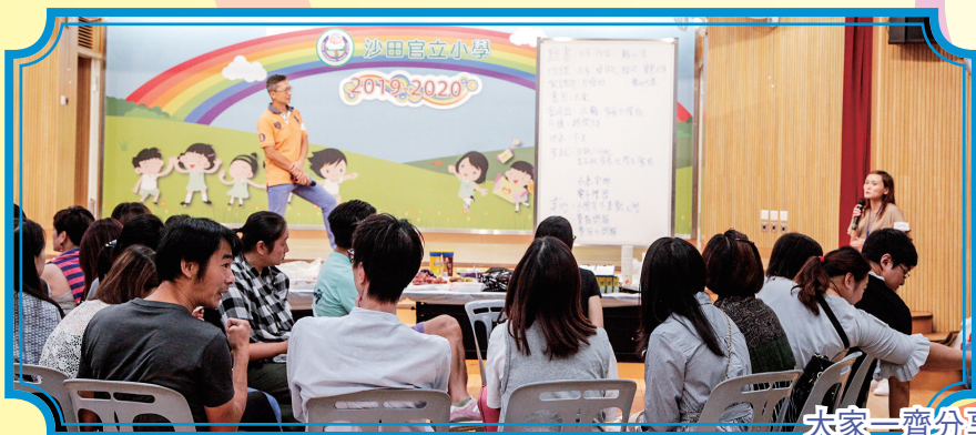
大家一齊分享管教子女的心得

為了加強家長間的溝通和聯繫，家長教師會舉辦了校園生活分享茶聚，藉此機會讓家長在輕鬆愉快的氣氛下，分享孩子在新學期的校園生活和交流養育子女的心得。