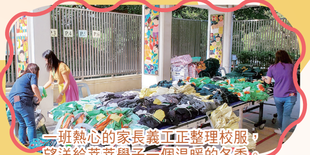
一班熱心的家長義工正整理校服，望送給莘莘學子一個溫暖的冬季。