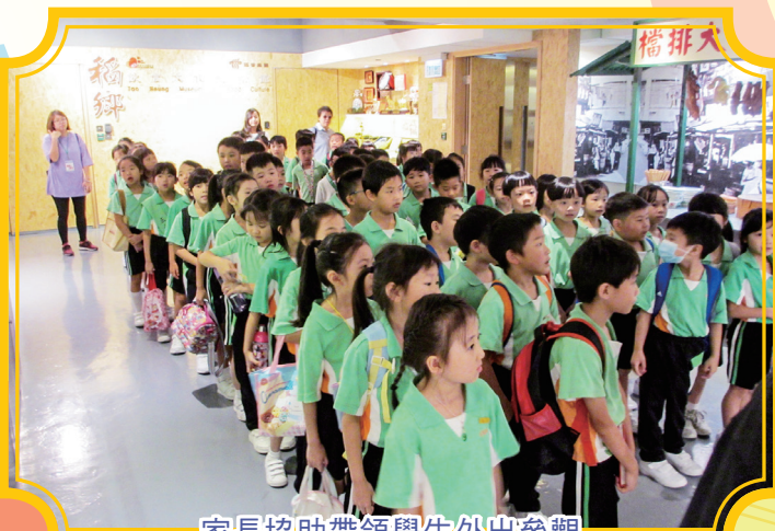
家長協助帶領學生外出參觀