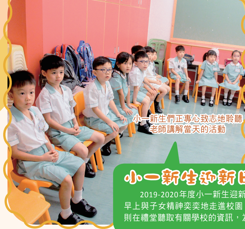
小一新生們正專心致志地聆聽老師講解當天的活動