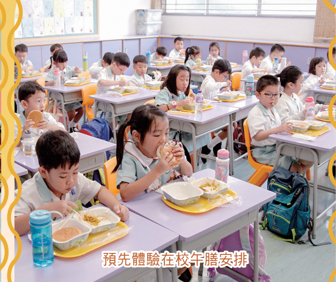
預先體驗在校午膳安排