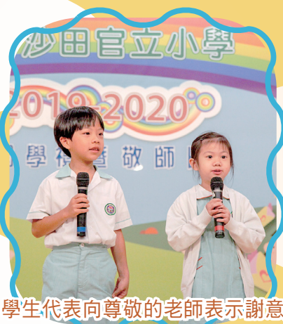
學生代表向尊敬的老師表示謝意