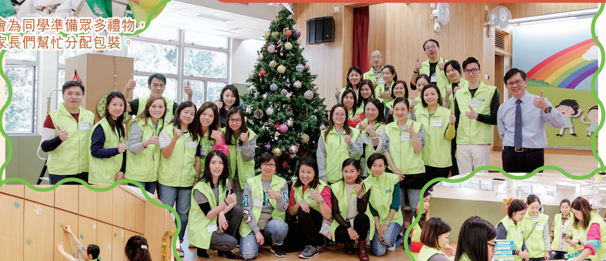
佈置結束後，一眾家長與校長在節日象徵的聖誕樹前合照。