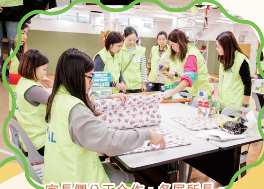
家長們分工合作，各展所長。