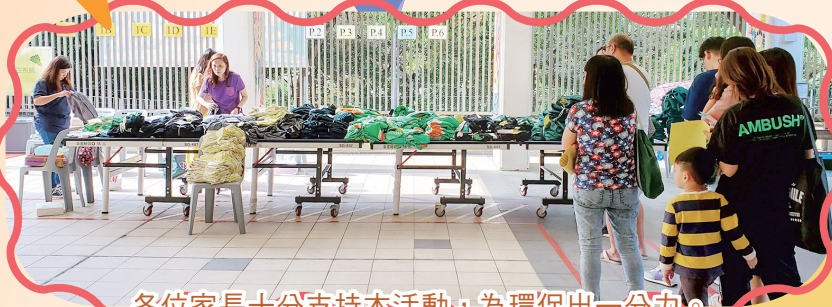
各位家長十分支持本活動，為環保出一分力。

為了響應環保，減少浪費，鼓勵資源盡用，家長教師會曾於上年度學期結束前舉辦「回收冬季校服」活動。經家長義工篩選及整理後，本會於11月1日（星期五）安排有興趣的家長及學生到學校正門領取舊校服，反應非常踴躍。