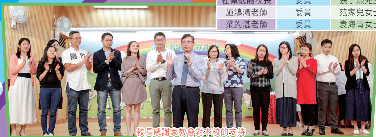
校長感謝家教會對本校的支持