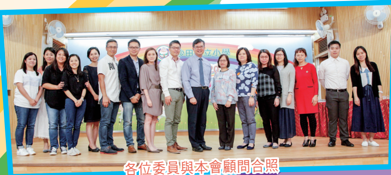
各位委員與本會顧問合照