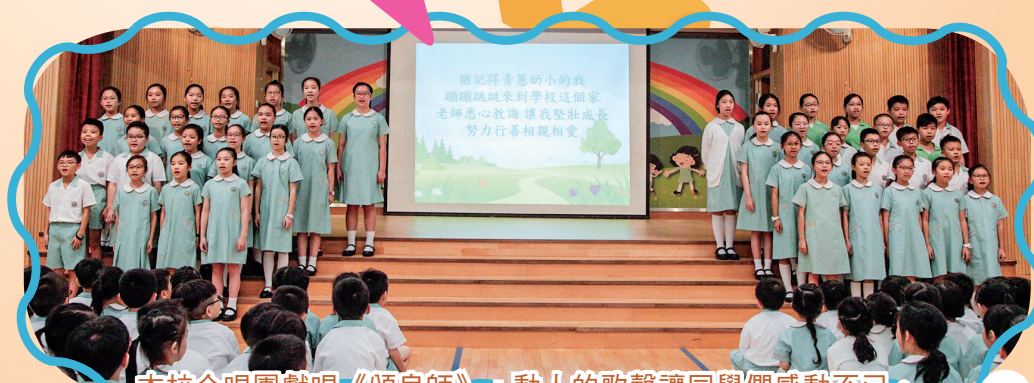
本校合唱團獻唱《頌良師》，動人的歌聲讓同學們感動不已。