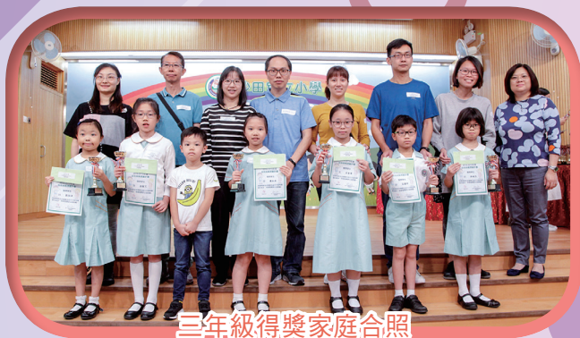
三年級得獎家庭合照