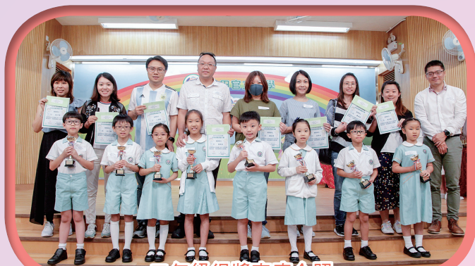
二年級得獎家庭合照