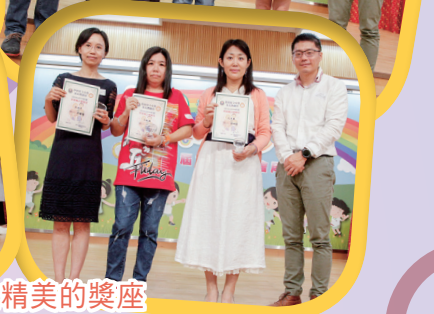
資深義工獲頒發精美的獎座