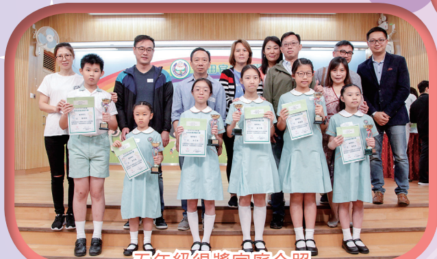
五年級得獎家庭合照