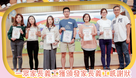
一眾家長義工獲頒發家長義工感謝狀