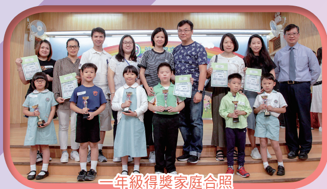
一年級得獎家庭合照